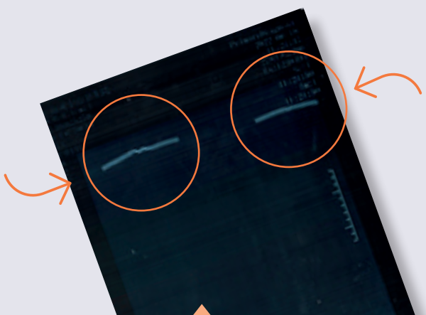
ANCIEN POSITIONNEMENT DU FIL DE BARYUM 1 (bandes claires horizontales supérieures)

LES RADIOGRAPHIES CI-DESSOUS ILLUSTRENT CE CHANGEMENT