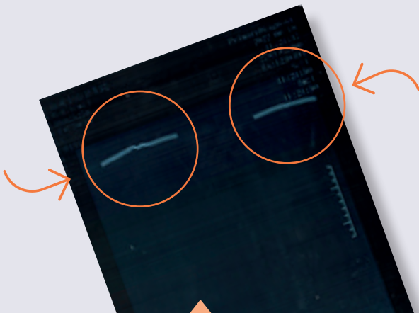
ANCIEN POSITIONNEMENT DU FIL DE BARYUM 1 (bandes claires horizontales supérieures)

LES RADIOGRAPHIES CI-DESSOUS ILLUSTRENT CE CHANGEMENT